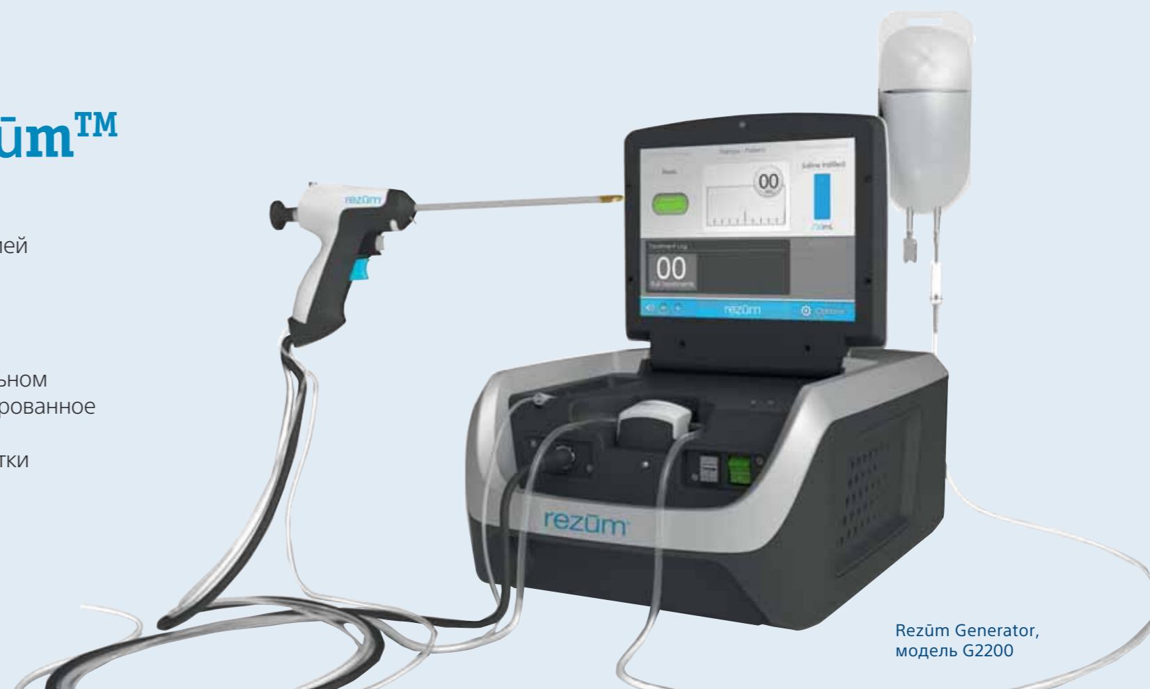
Rezūm Generator, модель G2200

Объем ткани уменьшается и это снижает симптомы, связанные с увеличением предстательной железы.